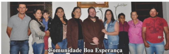
Comunidade Boa Esperança