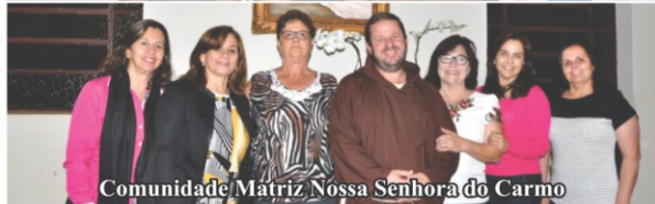
Comunidade Matriz Nossa Senhora do Carmo