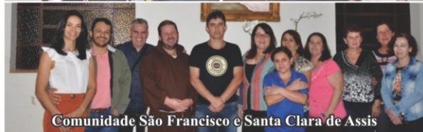
Comunidade São Francisco e Santa Clara de Assis