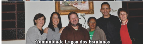
Comunidade Lagoa dos Estulanos