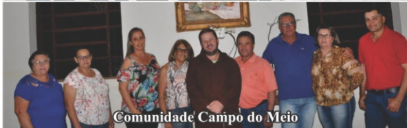
Comunidade Campo do Meio