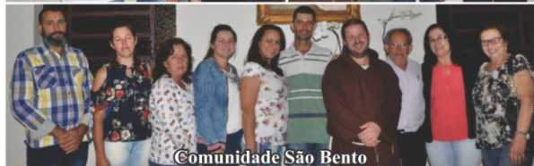
Comunidade São Bento