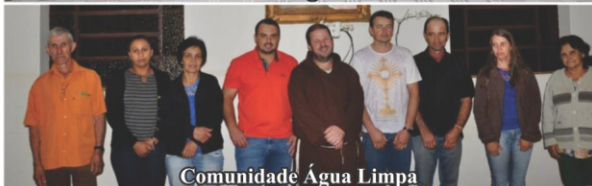
Comunidade Água Limpa