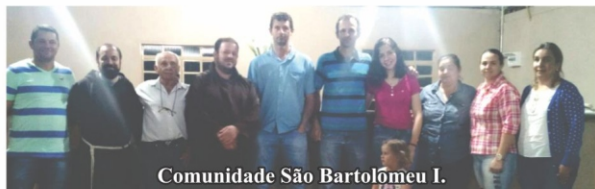
Comunidade São Bartolomeu I.

Eis as Novas Comissões Comunitárias de Pastorais.