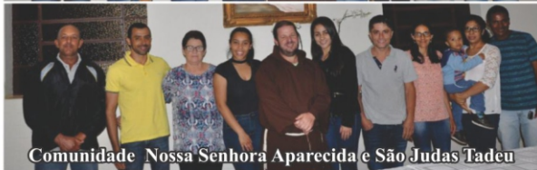
Comunidade Nossa Senhora Aparecida e São Judas Tadeu