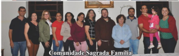
Comunidade Sagrada Família