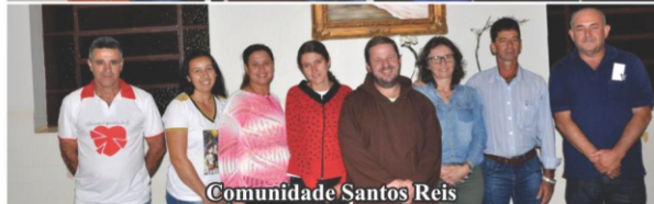
Comunidade Santos Reis